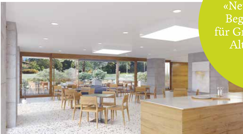
Einladend und gesellig: Speisesaal, Cafeteria, Aufenthalts- und Essbereiche

«Neue, wertvolle Begegnungsorte für Gross und Klein, Alt und Jung.»