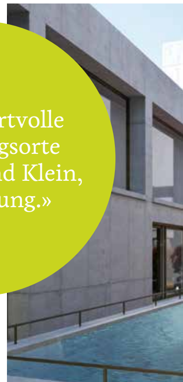
Ruhig und intim: Atrium mit Fischteich